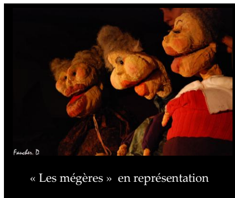
« Les mégères » en représentation

Souvenirs de la Martinique Toutes les nuits je rêve de toi Mon gigolo, mon Dominique La vie est belle pour ceux comme toi qui donnent leurs corps aux belles femmes qui donnent d'l'amour aux femmes comme moi T'as ça dans le sang, mon Dominique, L'tambour, le rhum, le vice et moi.