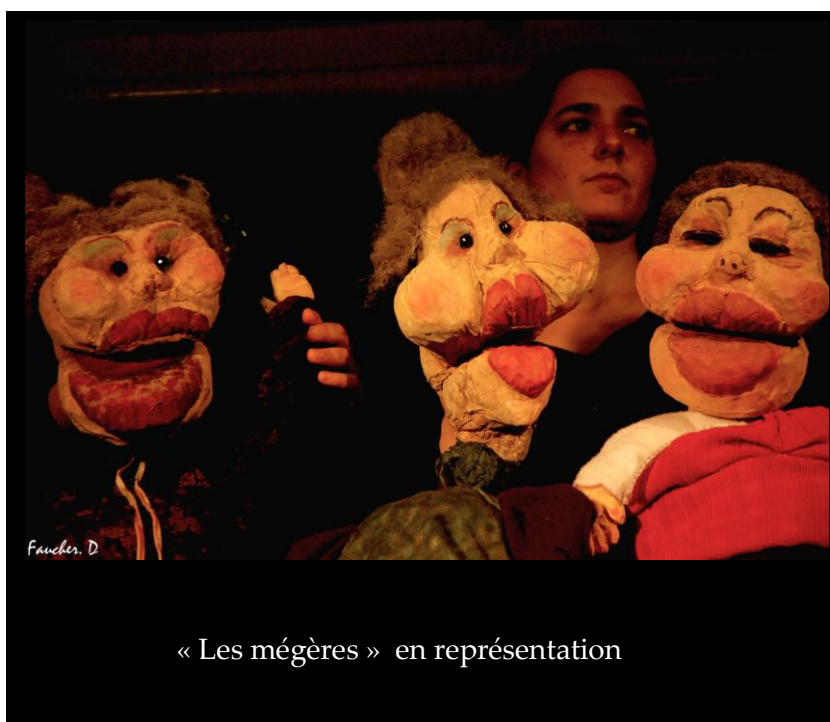
« Les mégères » en représentation

-Si c'est pas malheureux, on reconnaît plus les quatre saisons. Vivaldi serait bien ennuyé, y'aurait pas de quoi faire un disque... Tout de même c'est pas bien naturel... »