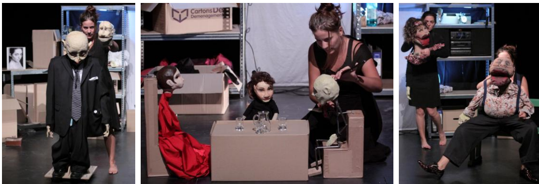
Quelques marionnettes du banc : de Gauche à droite : L'entrepreneur des pompes funèbre, la Mère, Celle qui reste, le Père, Mr et Mme Méchant

Une place importante est faite à la musique qui exprime une large palette de sentiments au travers d'un dialogue musical entre violon et accordéon. De nombreuses scènes, uniquement visuelles et musicales nous guident dans le voyage intérieur de Celle qui reste .